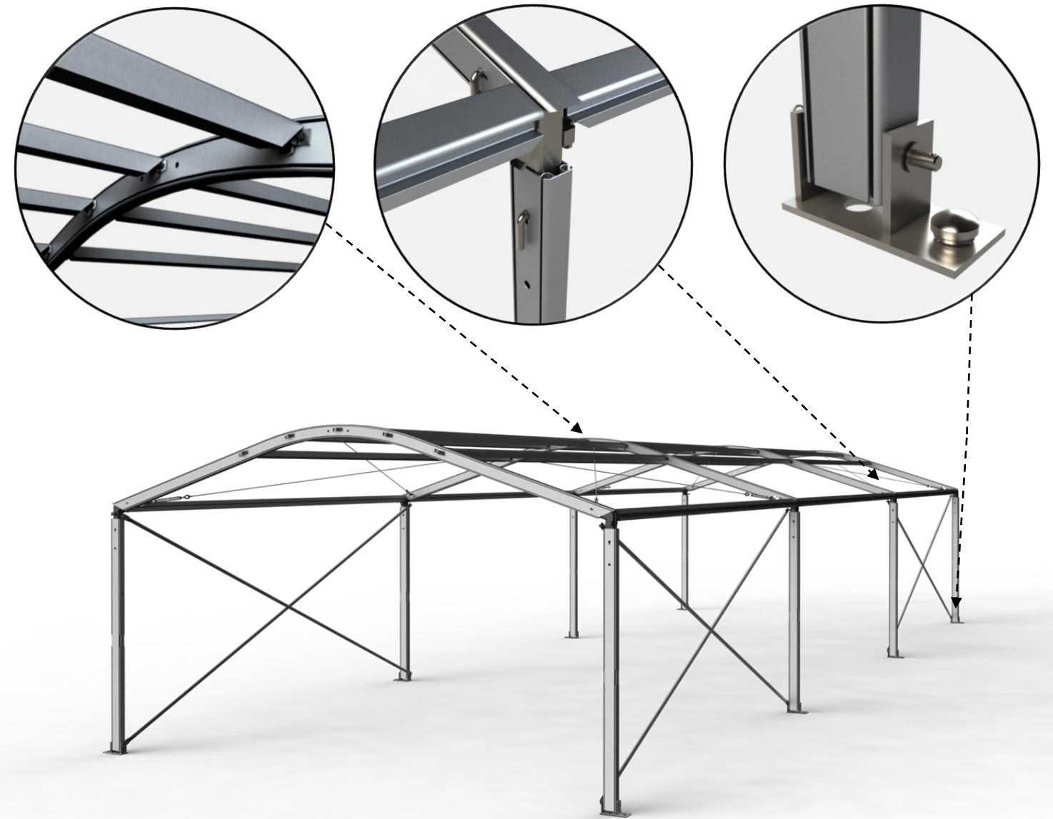
Digital impression; The actual tent will differentiate depending on chosen options